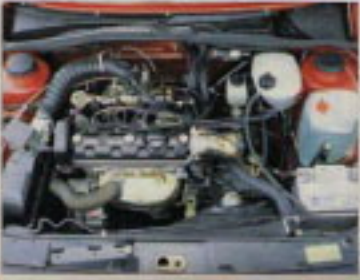
VW Golf ...