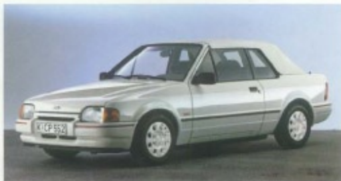
Winter- und wetterfest: das Schnellfaltverdeck.

Alle Abbildungen: Escort Cabrio XR3i, Radio-/ Cassetten- Kombination Sonder- Ausstattung.