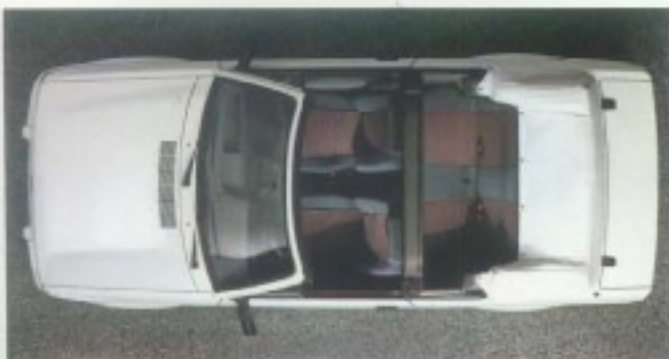
Sportplatz für 5.