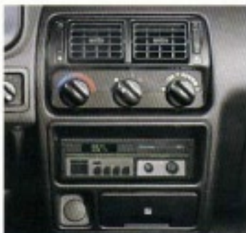
Da steckt Musik drin – Ford-UKW-Radio Sound 2002 mit Keycode-Diebstahlsicherung.