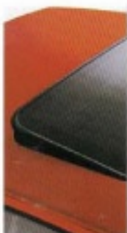
Für Frischluftfans – das aus getöntem Sicherheits