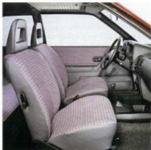
Großzügiger Innenraum mit körperechten Vollscheuhsitzen.

Der erste positive Eindruck, den das neue Ford-Sondermodell Escort Plus macht, setzt sich auch bei näherem Hinsehen fort. Zuverlässigkeit und Fahrkomfort zeichnen den Escort Plus aus und machen ihn zu einem besonders attraktiven Begleiter. Ganz gleich, ob Sie abends groß ausgehen oder einfach ins Blaue fahren.