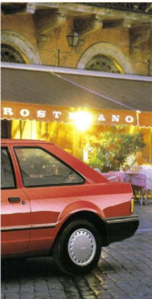
Der Escort Plus.